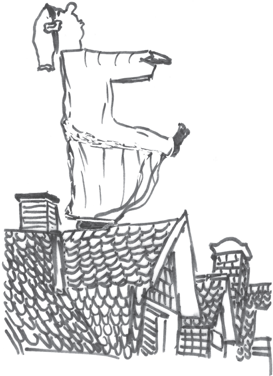
Un somnambule est encore souvent représenté ainsi de nos jours: dessin de Peter Brunner, ancien collaborateur de ZZ Wancor.