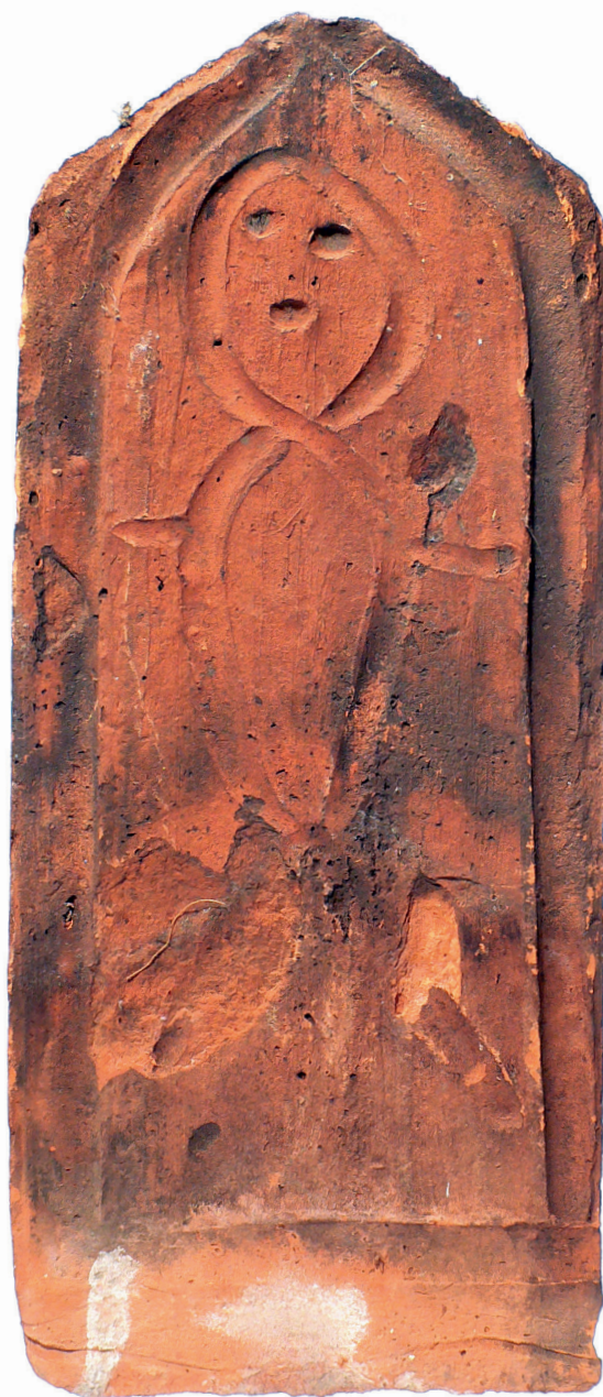
Tuile plate du 19e siècle avec un personnage dessiné au doigt dans l'argile humide.