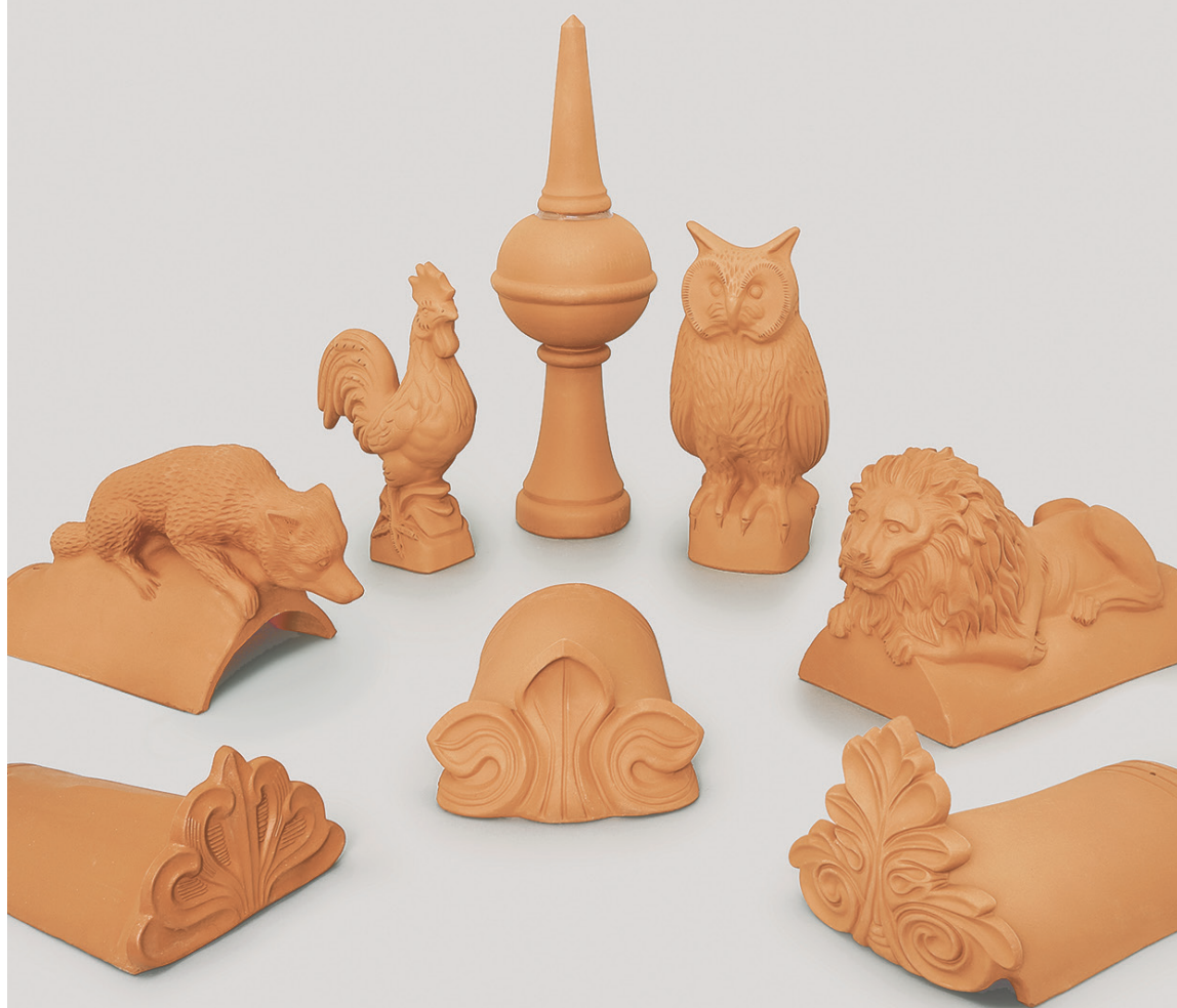
Figurines et décorations peuvent enrichir les toitures en tuiles historiques.