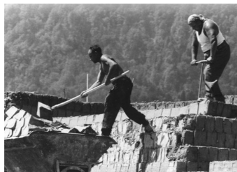
← Lehmstechen in der Grube Giesshübel