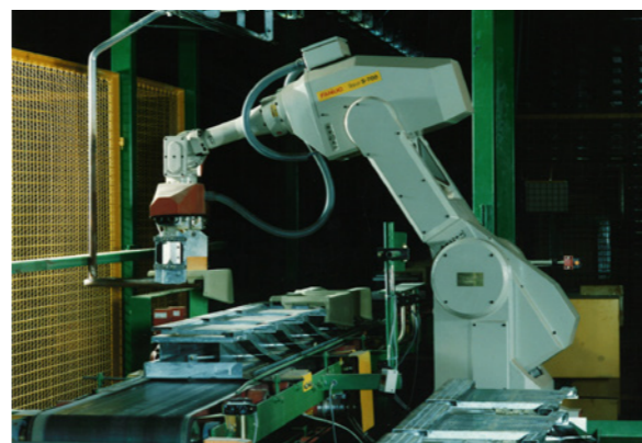
↑ Ankunft der Roboter