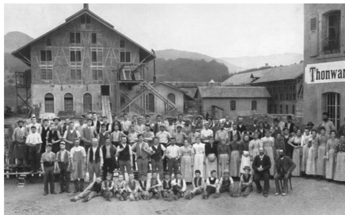
↑ Gründung Thonwarenfabrik Laufen