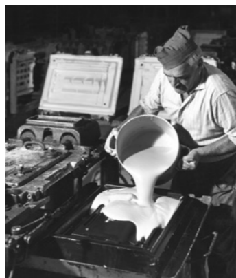
← Guss einer Pressform aus Gips, Formerei Istighofen