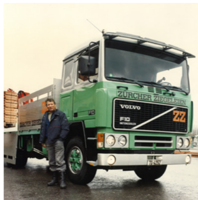
← Bis weit in die 90er-Jahre waren wir mit unserer eigenen Flotte unterwegs.